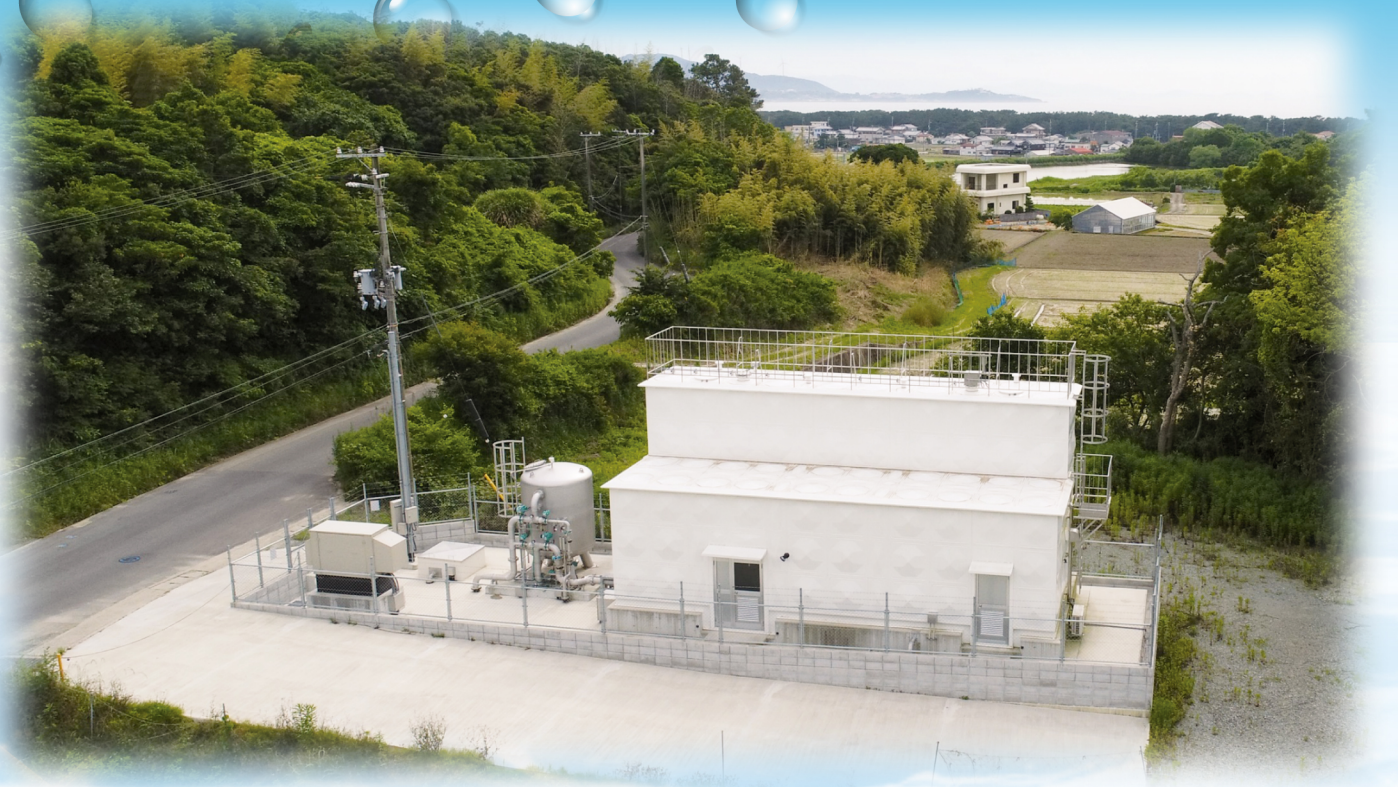
慶野浄水場(南あわじ市松帆慶野)

編集・発行 淡路広域水道企業団 《本庁》〒656-0452 南あわじ市神代浦壁792番地6 TEL:0799-42-5896 FAX:0799-42-5897 メールアドレス: kigyoudan@awaji-suido.jp ホームページURL: http://awaji-suido.jp/